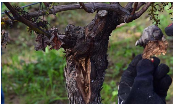
Image 3: 1ère étape de l'opération: ouvrir le tronc et localiser l'amadou

Cette expérience, bien que limitée, montre qu'après cette opération plus de 80% des plantes n'ont pas présenté de nouveaux symptômes. La plante est ensuite détoxifiée et renforcée et peut produire des fruits en pleine productivité.