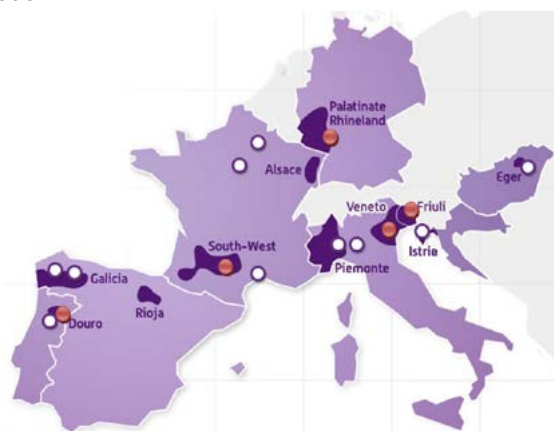
Figure 1: Areas where trunk cleaning is applied. Result from Winetwork interviews.

Le curetage est une pratique innovante pour le contrôle des MDB appliqué dans plusieurs régions. En France et en Italie, les viticulteurs réalisent le curetage par eux-mêmes ou alors font appel à des professionnels spécialisés dans ce type de méthode.