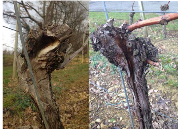
Image 2: Curetage du tronc réalisé par un viticulteur du Sud-Ouest (IFV South- West)

Selon ce vigneron, le curetage prend environ 5 minutes pour une souche.